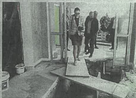
Jurbarko kultūros centro didžioji salė sutvarkyta, bet jos prieigos – kol kas dar ne. Pirmojo aukšto fojė šiuo metu yra statybvietė, po kurią tenka vaikščioti šiais tokiais „lilteliais“.

Antroji sąlyga – trys priešgaisriniai rezervuarai, kuriuos reikia įrengti norint užtikrinti priešgaisrinius pastato reikalavimus. Rangovai paaiškino, kad Jurbarko kultūros centro pastatas yra didelis, jame telpa per 500 žmonių, tad yra taikomi aukščiausi