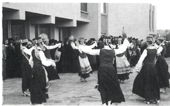
Tautiniais drabužiais pasipuošusios merginos šoka pasveikinimo šoki „Kepurinę“.

ros namų duryse ir linksmo maršo kviečiama saviveiklininkų eiseną patraukia Dariaus ir Girėno (tada – V. Kapsuko) gatve, kur „šiuolaikinėmis formomis puikuojasi ištaigingas naujas rūmas“.