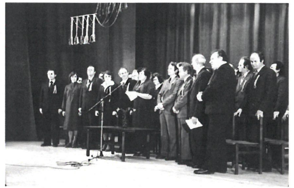
Atidarymo metu pagerbti kultūros darbuotojai, statybininkai ir kiti kultūros aktyvistai.