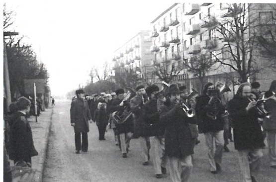
Linksmo maršo kviečiama saviveiklininkų eiseną patraukia Dariaus ir Girėno (tada – V. Kapsuko) gatve, kur „šiuolaikinėmis formomis puikuojasi ištaigingas naujas rūmas“.