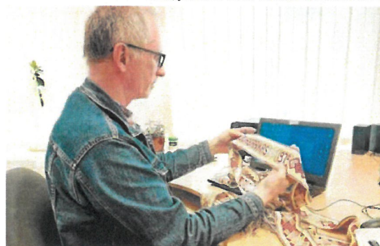
Režisierius G. Zareckas, Jurbarko kultūros centro metraštininkas, buvo išsiganęs, kad per kraustynes, bei remontus juostos galėjo pasimesti bet jos buvo saugioje vietoje, direktorės kabinete.