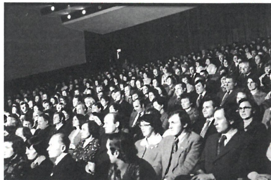
Į kultūros namų atidarymo šventę susirinko gausus būrys žiūrovų, kurie stebėjo pirmuosius pasirodymus.