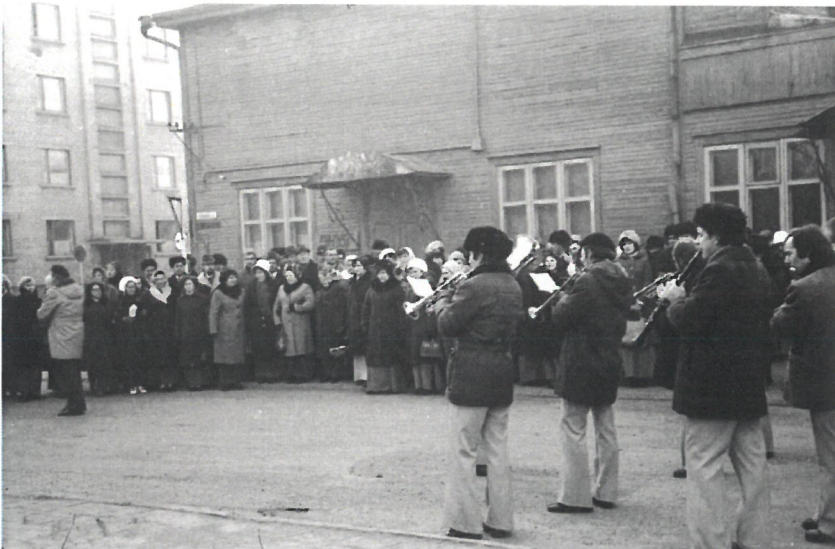
Kultūros darbuotojai atsisveikina su senuoju kultūros pastatu. Senas medinis pastatas, išlikęs tik nuotraukose ir vyresnių jurbarkiečių atmintyje (dabar toje vietoje stūkso prekybos centras „IKI“, – aut. past).