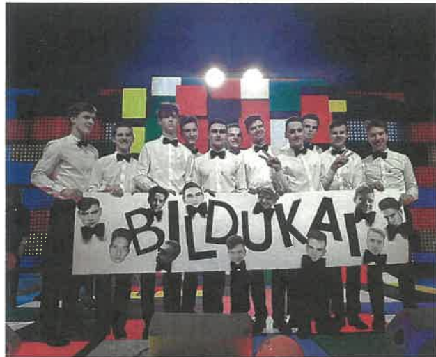
Vaikinų vokalinis ansamblis „Bildukas“ 2018 metų Lietuvos vaikų ir moksleivių televizijos konkurse „Dainų dainelė“.