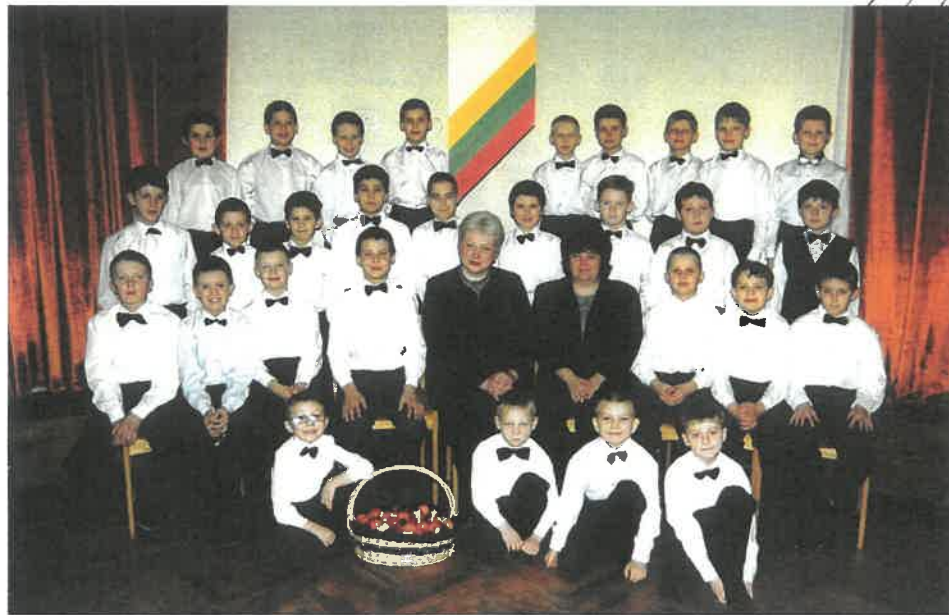
Pirmasis choro „Bildukas“ koncertas 2002 m. kovo 11 d.