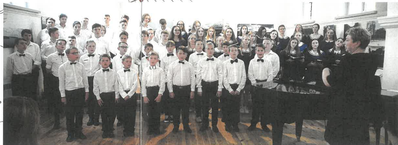
Atsiveikinimo su chorų koncertas „Su daina į gyvenimą“ 2021 metais.