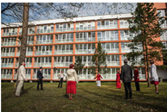
2020 m. renginio „Linkėjimai iš žibučių pievelės“, skirto Medikų dienai, akimirka.

„Linkėjimai iš žibuoklių pievelės“. 2021 m. visuomenei buvo pristatyta mano pačios spaudai parengta antroji knyga („Tiltai į tėviškę“) apie Konstantino