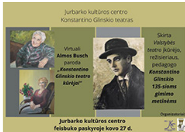
Kraštiečio poeto ir vertėjo Antano Gailiaus 70-mečiui skirto renginio ir A. Buch virtualios parodos „Konstantino Glinskio teatro kūrėjai“ reklaminiai plakatai