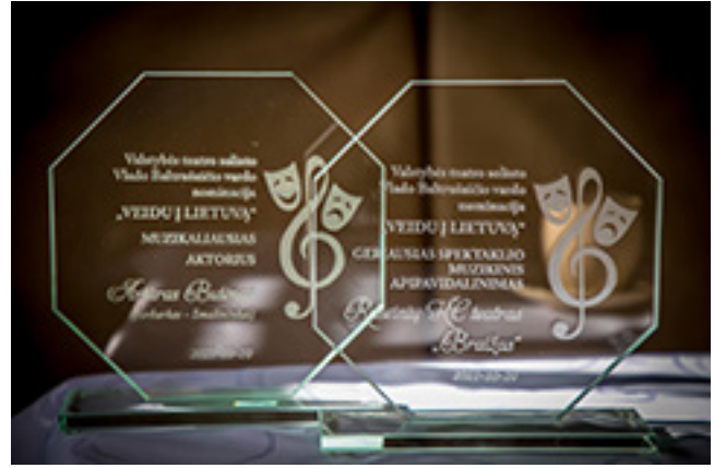
2021 m. festivalio „Senjorai ir jaunystė“ nominacija „Veidu į Lietuvą“.

– Jau greit bus 40 metų, kaip Jūs pati šiame teatre. Kokios kolektyvo tradicijos buvo labiausiai puoselėjamos Jums atėjus į teatrą, kokios susiformavo naujos ir kaip jas pavyksta išlaikyti?