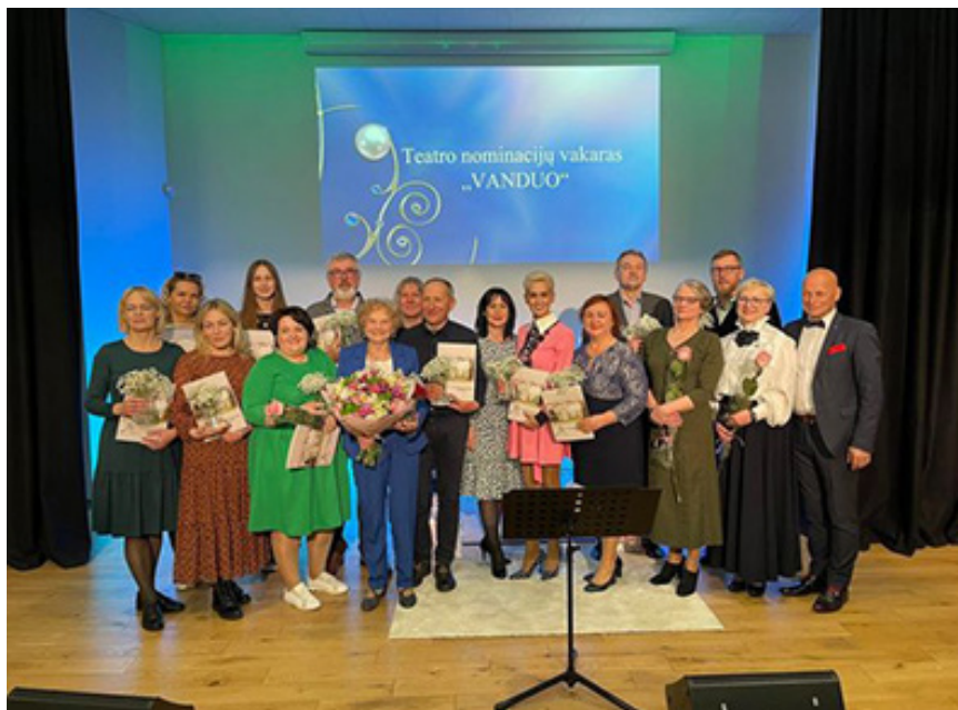
Grupė Konstantino Glinskio teatro nominacijų vakaro „Vanduo“ renginio dalyvių. 2022 m. kovo 26 d.

– Pačiu sunkiausiu pandemijos laikotarpiu, stengėmės bendrauti su teatro senjorais, paskambindami jiems telefonu bent porą kartų per savaitę. Domėjomės jų poreikiais ir padėjome jiems spręsti tiesiogines su sveikata susijusias problemas. Organizavome kaukių siuvimo veiklas, nes iš pradžių