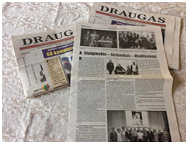
Straipsnis apie Jurbarko K. Glinskio teatro renginį, skirtą A. Stulginskiui, JAV lietuvių leidinyje „Draugas“.