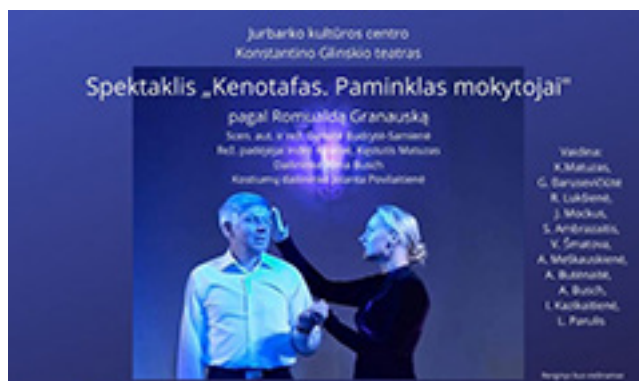
Spektaklio „Kenotafas. Paminklas Mokytojai“ plakato fragmentas